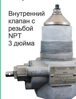
Внутренний клапан с резьбой NPT 3 дюйма