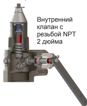
Внутренний клапан с резьбой NPT 2 дюйма